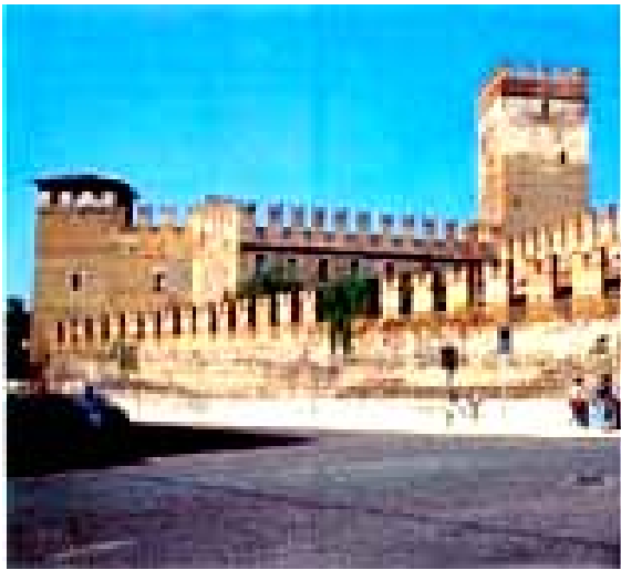
“Кремль” в городе Вероне (1354-1357)

Так вот, не являются ли зубчики нынешних Кремлёвских стен результатом тысячелетней эволюции рогов древнегреческого Минотавра?...