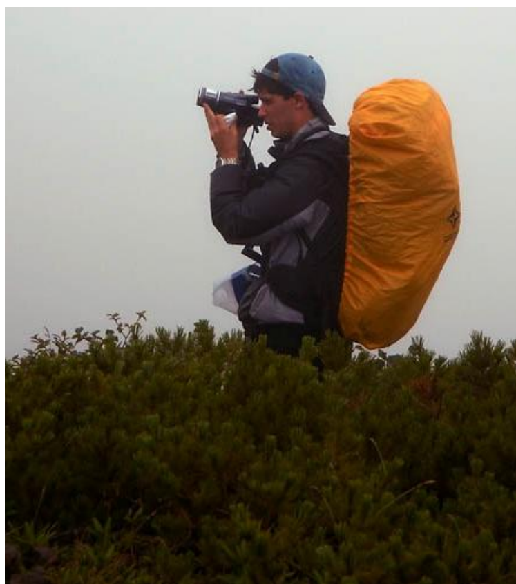
А.Бр. в зарослях кедрача. Вот такой высоты кедровые... кусты, с шишками.