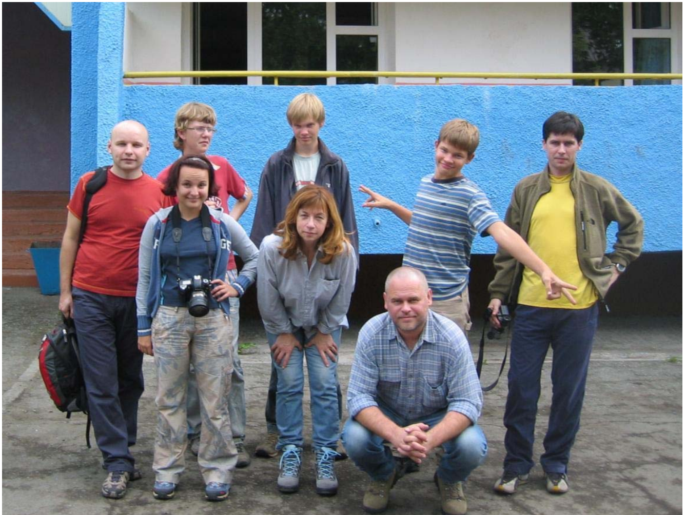
День 0. Гостиница “Гелиос”. Мы пока выглядим “огурчиками”.