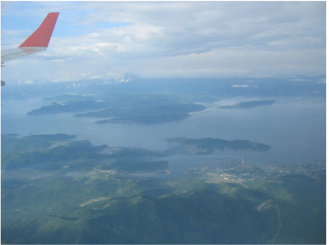
Петропавловск-Камчатский и Авачинская бухта.